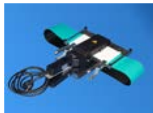
Outilage de jonction rapide RAPPLON® QSP 105