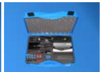
Kit de montage de l'outilage de jonction rapide RAPPLON®